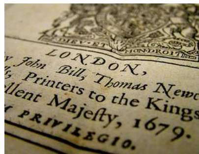
Détail de l'Habeas Corpus