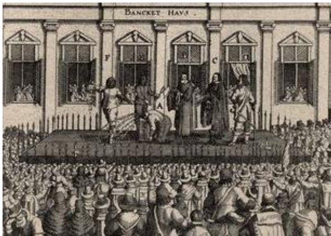
L'exécution de Charles Ier, gravure allemande d'époque

En 1685, à la mort de Charles II, son frère Jacques II lui succède et reprend les arrestations arbitraires ce qui conduit à une seconde révolution (la Glorieuse Révolution : 1688-1689). Le Parlement produit alors un second texte en 1689 : la Déclaration des Droits ( Bill of Rights ) qui limite définitivement les pouvoirs du roi au profit du Parlement. Les principales libertés y sont reconnues et le Parlement reçoit l'essentiel des pouvoirs en matière de lois, d'impôts et de guerre.