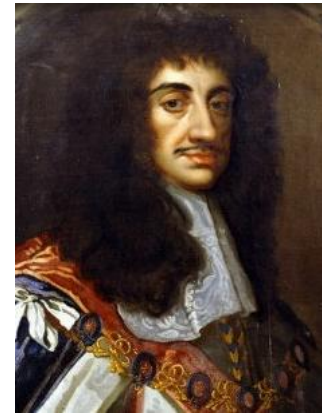
Charles II d'Angleterre