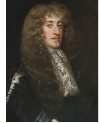
Jacques II d'Angleterre

Le roi Charles Ier cherche à instaurer une monarchie absolue sur le modèle français. L'Angleterre entre alors dans une période de guerre civile entre les partisans du roi et les parlementaires (1641-1649). Les parlementaires victorieux condamnent Charles Ier à mort pour haute trahison. Il est décapité en 1649.