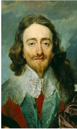
Charles Ier d'Angleterre, par van Dyck