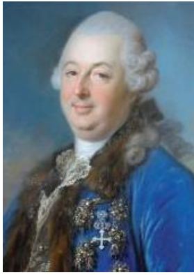
Louis XVI accepte cette Constitution civile du Clergé à contre cœur