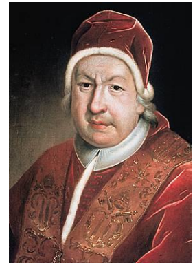
Le pape Pie VI rejette violemment cette Constitution civile du Clergé

Certains prêtres prêtent serment : les prêtres jureurs