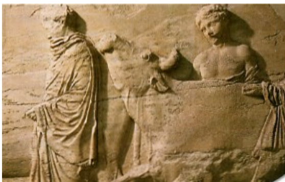
Tous les citoyens sont amenés à participer aux grandes fêtes religieuses telles que les panathénées ; ici, en conduisant des bœufs au sacrifice. Fragment de la frise du Parthénon sculptée par Phidias.