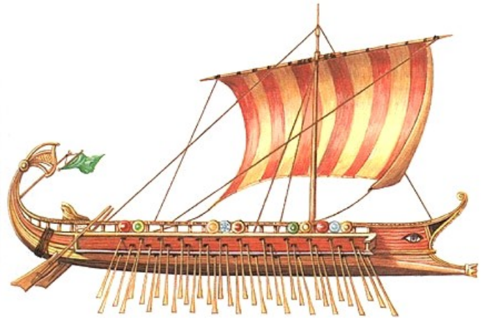
Les citoyens les plus pauvres servent comme rameurs à bord des navires de combat nommés trières