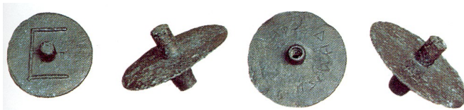
Jetons de condamnation ou d'acquittement à l'Héliée. Condamnation lorsque la tige est creuse ; acquittement lorsqu'elle est pleine. Les jetons étaient tenus entre deux doigts et déposés dans un vase