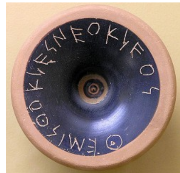
Tesson d'ostracisme où le citoyen inscrit le nom de celui qu'il veut chasser de la cité pendant 10 ans