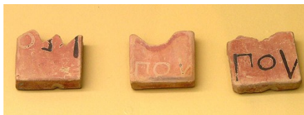
Jetons de tirage au sort pour désigner les membres de l'Héliée et de la Boulé