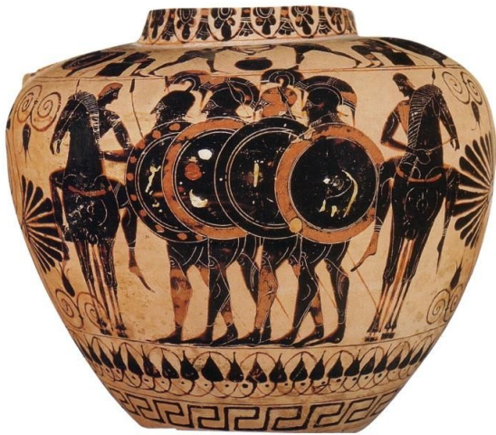
Vase à figures noires représentant des hoplites et des cavaliers