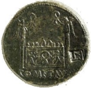
L'autel des trois Gaules