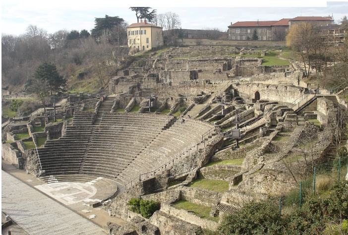
Théâtre de Lyon sur la colline de Fourvière