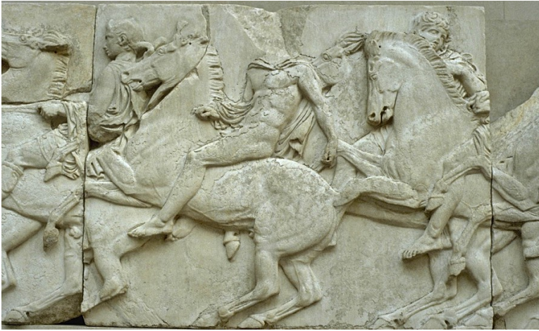
Détail de la frise du Parthénon, défilé de cavaliers