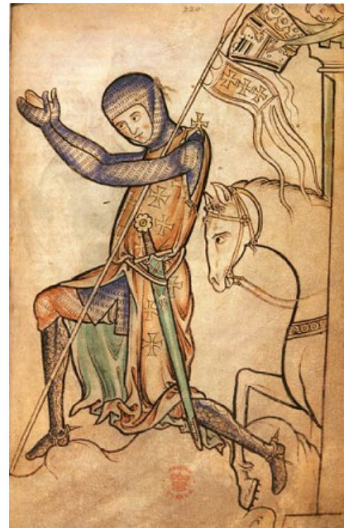
Templier, Psautier de Westminster, Londres, vers 1250

Repérez sur ces documents les différents visages de l'Église chrétienne aux XIe-XIIIe siècles