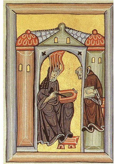
L'abbesse bénédictine allemande Hildegarde de Bingen recevant l'inspiration divine, Scivias Codex, 1174