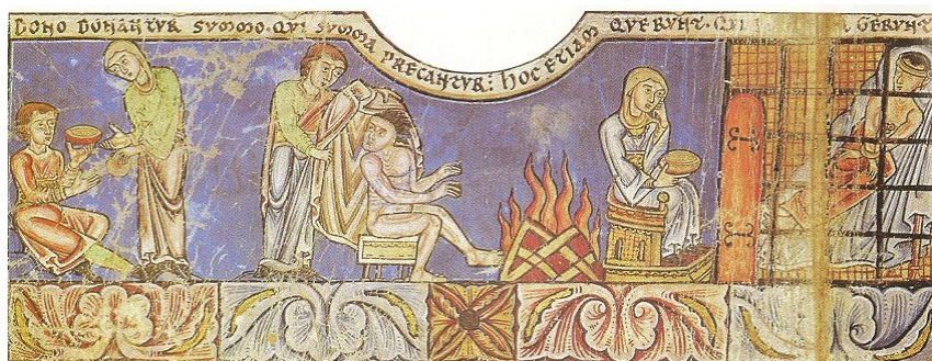
Les œuvres de charité. Bible de Floeffe, XIIe siècle. British Museum, Londres

- le maître: O, chers enfants attentifs, votre maître vous demande de vous préparer aux exercices religieux et de bien vous conduire en tous lieux. Chantez ensemble, demandez pardons pour vos péchés, et sortez de la salle sans dire de plaisanteries."