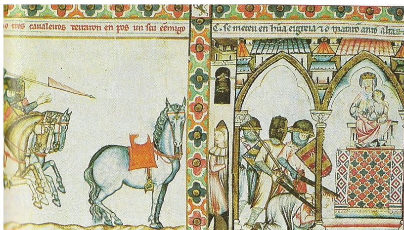
Cantigas de Santa Maria, XIIIe siècle, Bibliothèque de l'Escorial, Espagne