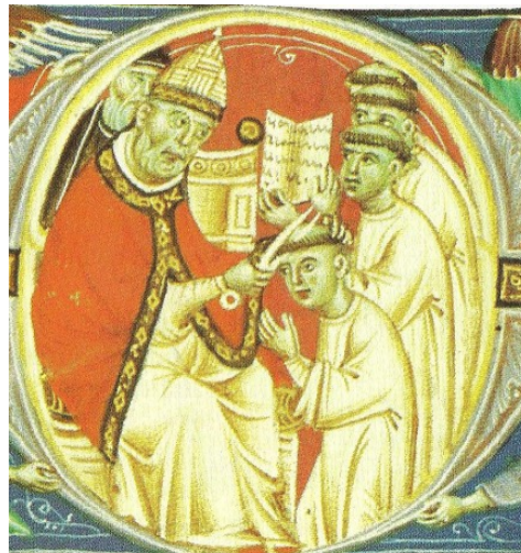
Scène d'entrée dans les ..... avec la tonsure d'un clerc par le pape. Manuscrit, fin XIIIe siècle, BNF.

Associez le sacrement correspondant à chacune des illustrations ci-contre