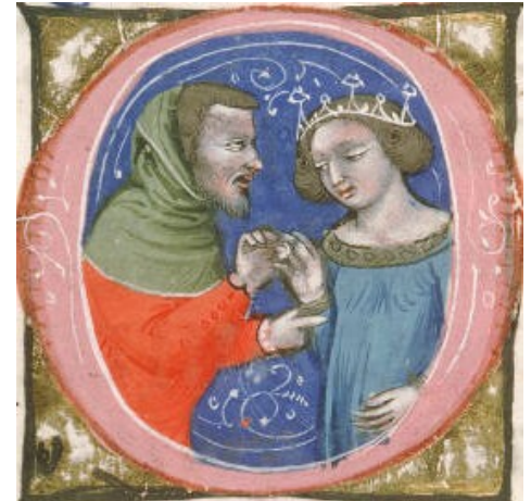
Scène de ....., Missel romain, BM Avignon, vers 1370.