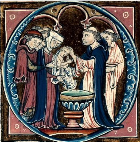
Scène de ....., Pontifical à l'usage de Beauvais adapté à l'usage de Lisieux. BM Besançon, XIIIe siècle.