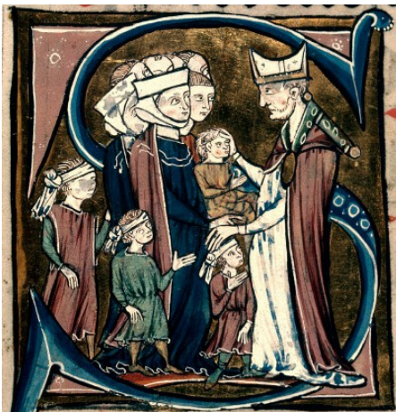
Scène de ....., Pontifical à l'usage de Beauvais, adapté à l'usage de Lisieux, BM Besançon, XIIIe siècle.