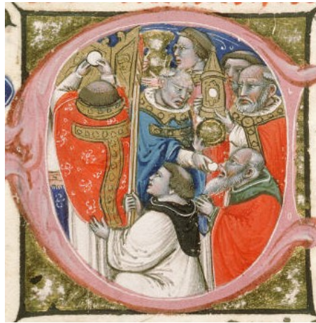
Scène d'....., Missel romain, BM Avignon, vers 1370.