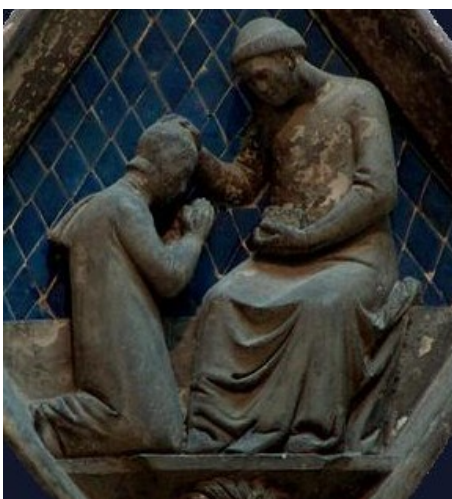
Scène de ....., Maso di Banco, XIVe siècle.