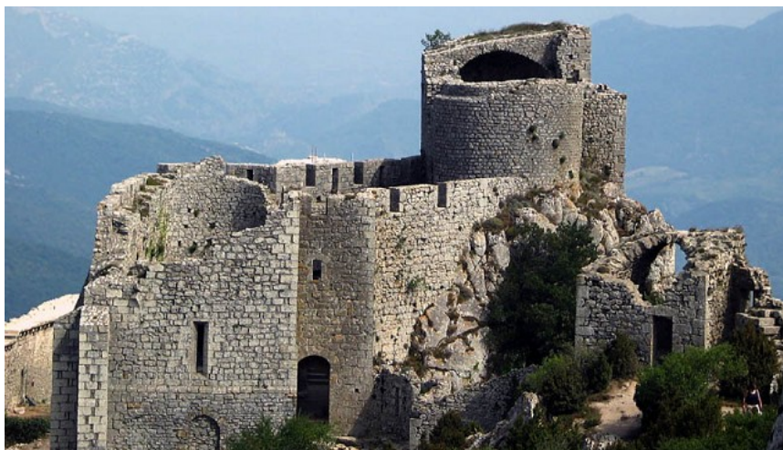
3- Château de Peyrepertuse dans l'Aude (Languedoc-Roussillon)

Césaire de Heisterbach, Dialogue des Miracles , 1219-1223