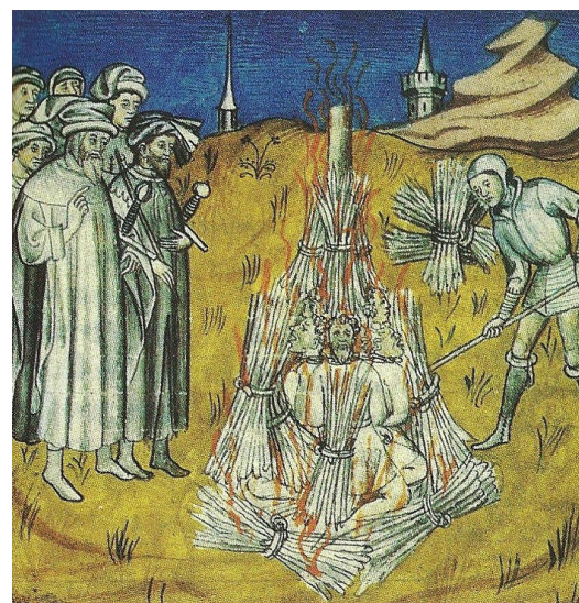
4- Des hérétiques cathares sur le bûcher. Miniature, manuscrit du XIIIe siècle, Bibliothèque municipale, Toulouse