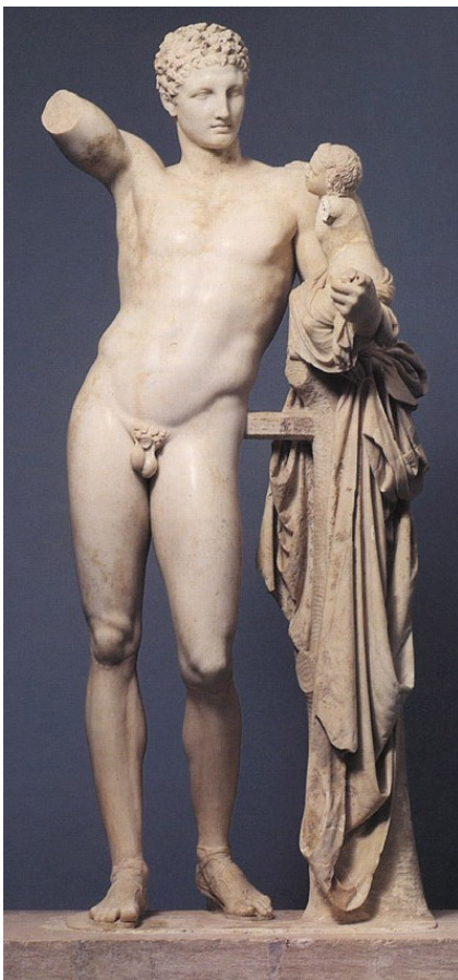
Hermès portant Dionysos, Praxitèle, Olympie, Ve siècle av. J-C.