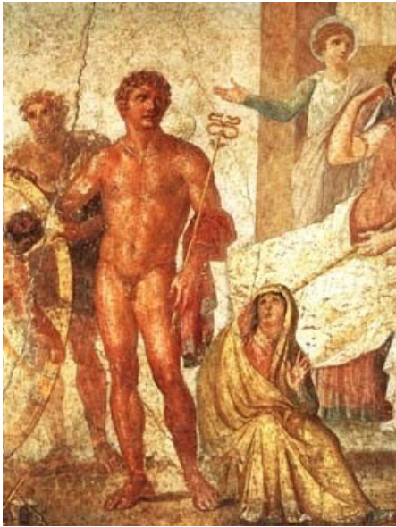
Casa Vetti, Pompéi