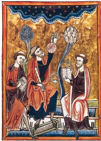
Psautier de Saint-Louis, manuscrit enluminé, Paris, BNF