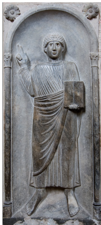
L'apôtre, Basilique Saint-Sernin, Toulouse, XIe siècle