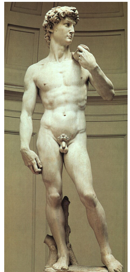
David de Michel-Ange, Galerie de l'Académie, Florence, 1501-1504